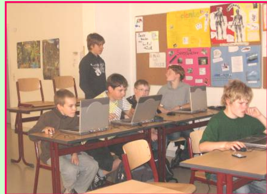
● GIS Bearbeitung